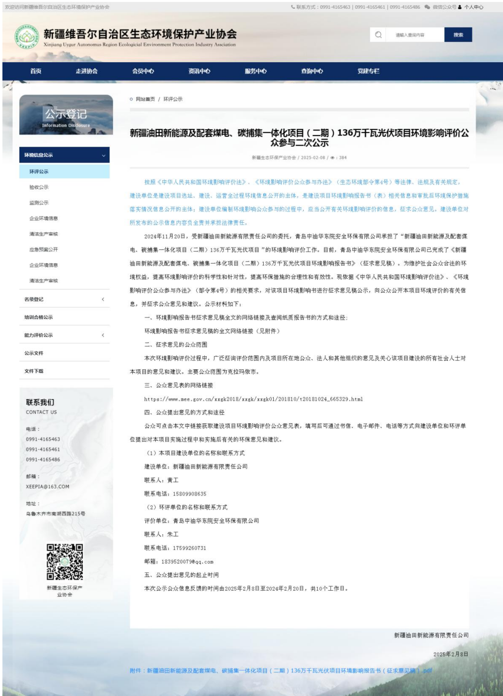
图 3.2-1 征求意见稿网上公示