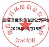
图 2.2-1 第一次公示截图